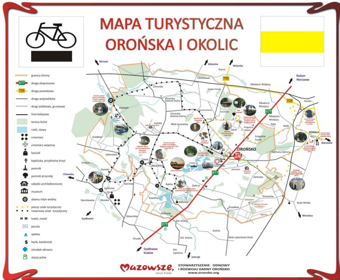
Fot. Mapa turystyczna