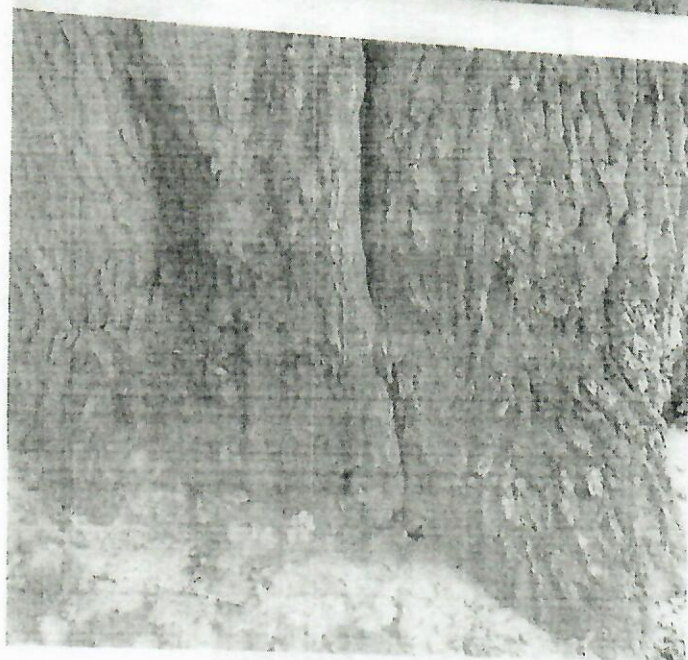
Widoczne rozerwanie 4cm

Czwartaka powoduje postępujące zmiany stwarzające zagrożenie dla ludzi i mienia. Na całym Czwartaku występuje posusz 40% co świadczy o jego obumieraniu. Wyrwa która powstała po obaleniu jednego z drzew Czwartaka