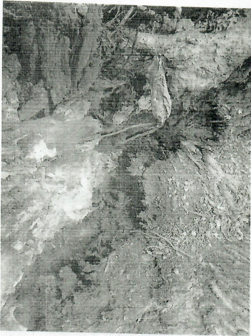
Widoczna martwica drzewa i próchnica